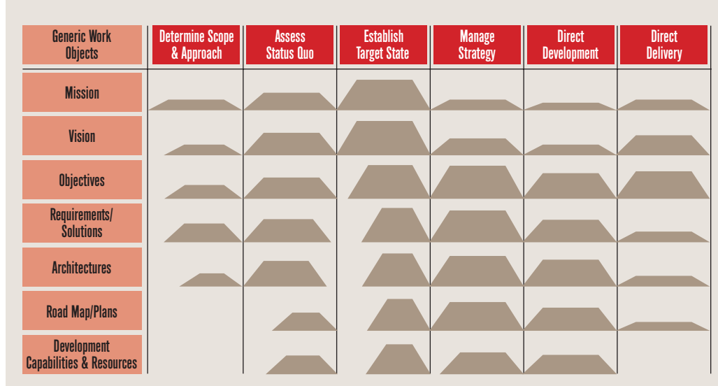
Afbeelding 2: Direct the Business – Work Object Activity Diagram.